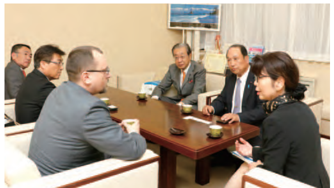
稗苗富山県議会議長を表敬する大使一行