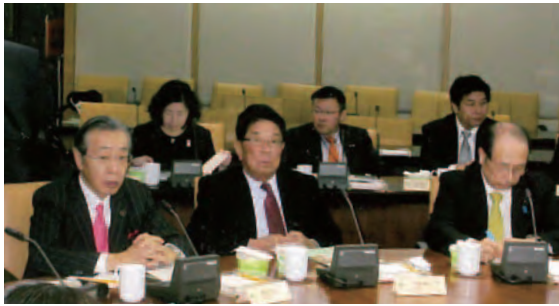
農業に関する意見交換会