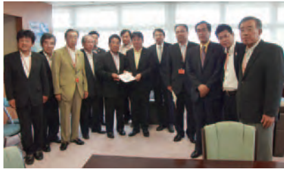
2015年7月24日(金) 国土交通省にて