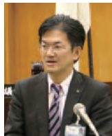
新田知事政策局長

北陸電力志賀原発2号機の原子炉建屋に雨水が流入したトラブルについて、北陸電力に対し、県民の安全・安心を守る観点から、大変重大な問題であり、早期の原因究明と再発防止