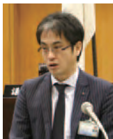
亀井観光・地域振興局長

観光地域づくりの推進に向けて、県と県立大学が共同研究している旅行者データの分析結果を基に、地域ごとの施策を検討する。宿泊施設や農林漁業者等と連携した食の磨き上げ、季節やテーマに応じた観光素材を取り入れた新たな着地型の旅行商品造成・販売など戦略的なプロモーションに取り組んでいきたい。