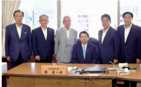
橘慶一郎復興副大臣と