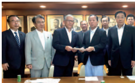
自由民主党本部にて要望書の提出 二階俊博幹事長と