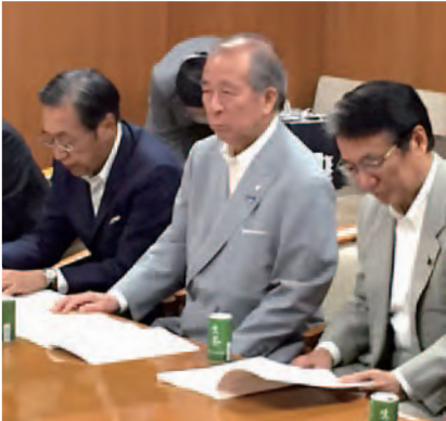
自由民主党本部にて