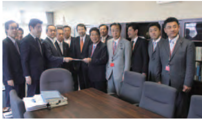
2015年5月7日(木) 国土交通省にて

富山県西部地域公共交通活性化議員連盟にて 北陸新幹線「かがやき」臨時便継続停車の要望書を提出。