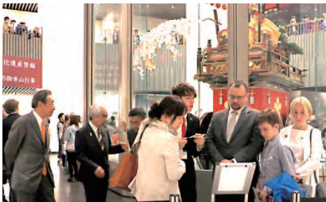
高岡御車山会館にて説明を受ける大使ご家族

高岡御車山祭への招待を受けて、ポーランド大使と在日ポーランド商工会議所副会頭が来高され、高岡御車山会館を見学されました。