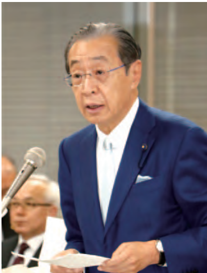
2017年3月15日(水) 予算特別委員会にて