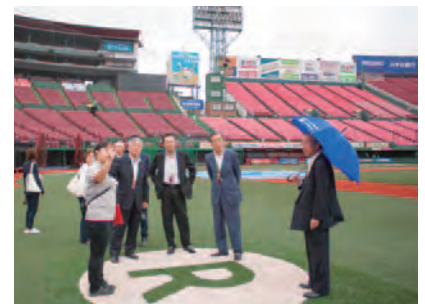
楽天KOBOSタジアム宮城