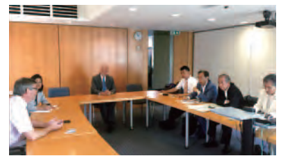
フランスナント市 ライトレールについて意見交換