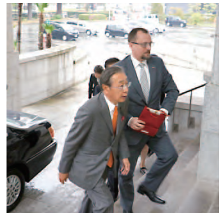
県庁正面玄関にてポーランド大使を 出迎える県議