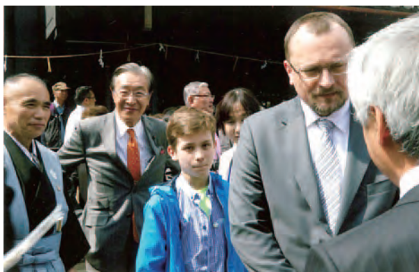
高岡御車山会館にて