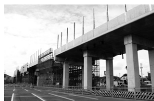
下伏間江高架橋工事