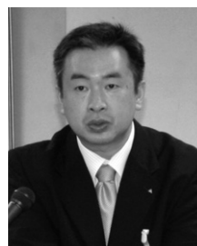
出口経営管理部長

【出口経営管理部長】 地方の自立には、地方税の充実が必要である。三位一体改革により縮小した地方交付税の財源調整機能、財源保障機能の復元・充実を図るため、地方六団体等と連携しながら働きかけていきたい。