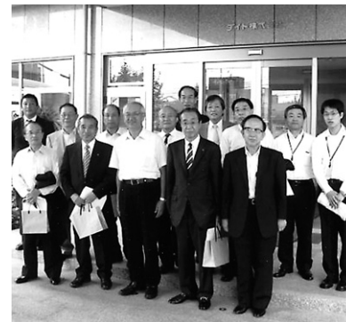
ダイト株式会社にて