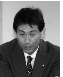
戸高商工労働部長

【戸高商工労働部長】 伝統工芸品の新商品や新たな用途提案を行う販路開拓マイスター事業や、万引き防止緊急対策特別事業、映画等誘致推進調査事業などの観光事業でも雇用を増やしていきたい。