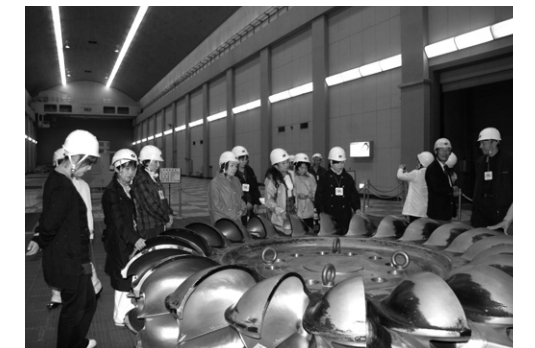
第四発電所タービン