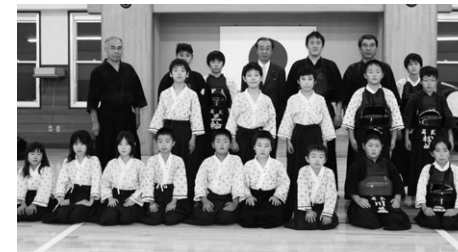
高岡市剣道連盟の皆さんと