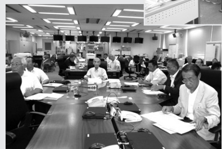
総務省消防庁 危機管理センターにて