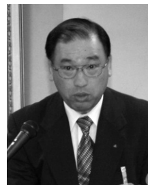
柳野知事政策局長

【柳野知事政策局長】 概算要求の組み替えで、政策コンテストを実施し予算配分を決めるなど、これまでにない動きが見られる。全国知事会等と連携しながら、来年度政府予算案に要望事項が反映されるよう、12月議会を11月に行い予算を決めるなど適時適切に対応していきたい。