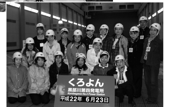
黒部ダム第四発電所にて