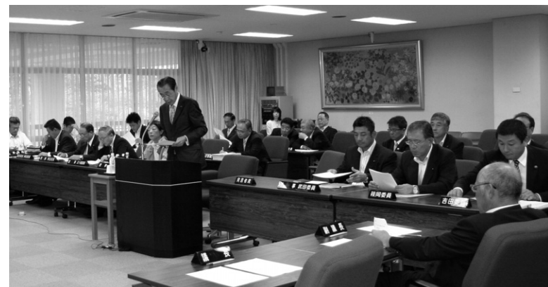
富山県議会 9月議会 予算特別委員会